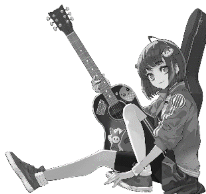
加古川市まちの魅力発信キャラクター かこのちゃん